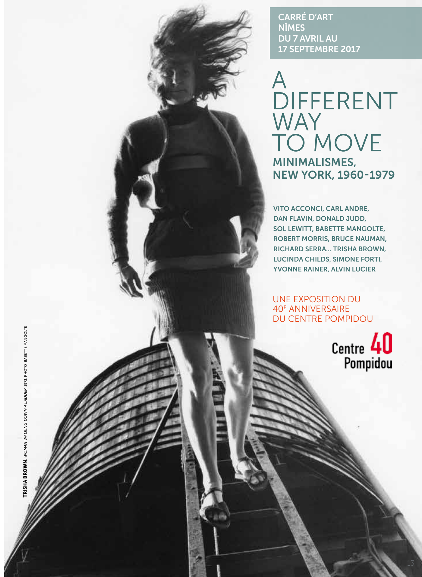
TRISHA BROWN. WOMAN WALKING DOWN A LADDER, 1973.