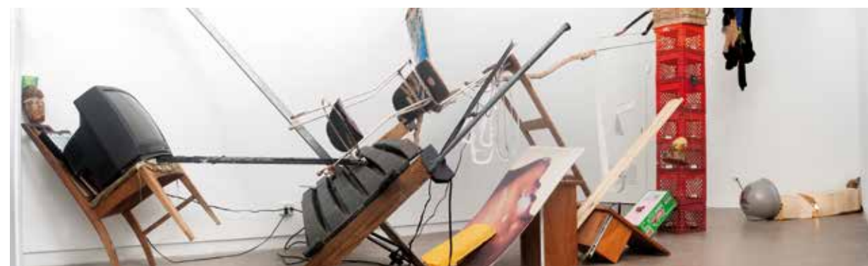
ABRAHAM CRUZVILLEGAS, VUE D'EXPOSITION, AGUSTINA FERREYRA GALLERY, SAN JUAN PUERTO RICO, 2016. © ABRAHAM CRUZVILLEGAS.