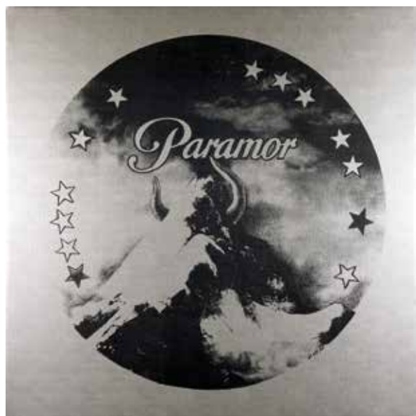
HIPPOLYTE HENTGEN. JUILLET, 2016. © HIPPOLYTE HENTGEN