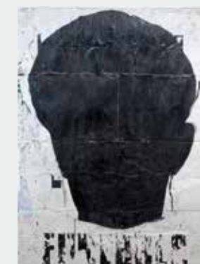
↑ JEAN-CHARLES BLAIS. SANS TITRE, 1992. © ADAGP, PARIS 2016. PHOTO D. HUGUENIN