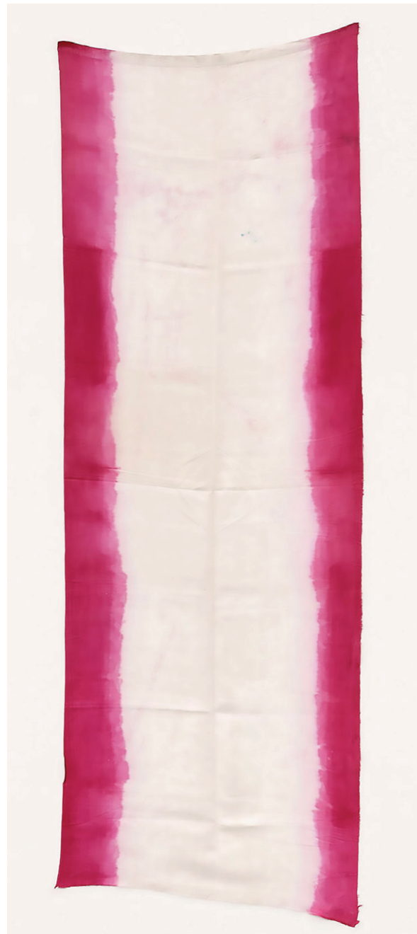
↓ NOËL DOLLA TISSU TEINT, 1967. PHOTO RÉMI VILLAGGI. © ADAGP, PARIS, 2017