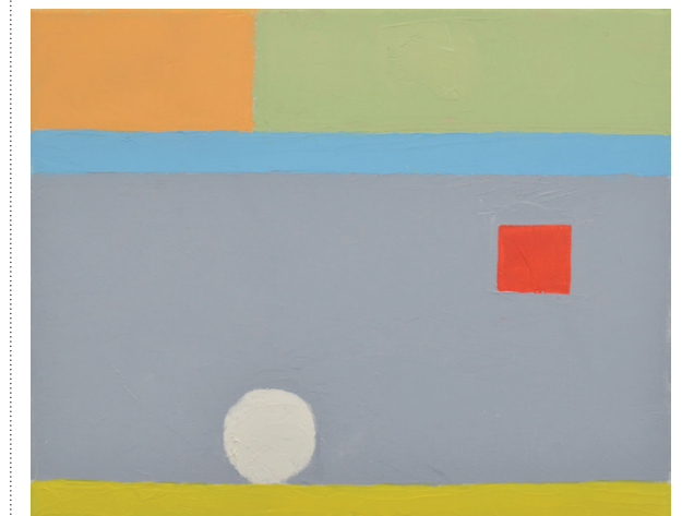
↑ ETEL ADNAN SANS TITRE, 2012. © ETEL ADNAN