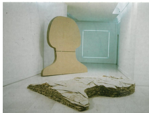
Martial Raysse, Guézé I , Guézé II et Monik I , 1968