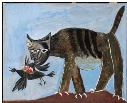
Chat saisissant un oiseau, 1939