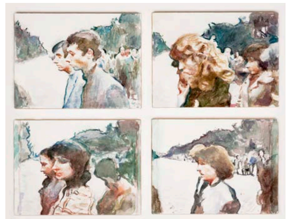
The Procession , 2016

Les images isolées de leur contexte historique passent dans une autre temporalité où d'autres narrations peuvent être construites. Au regard de l'actualité, on peut trouver dans ces peintures un écho aux cortèges de réfugiés qui ont traversé une partie de l'Europe. Il est très proche de ce sujet, ayant lui-même quitté l'Albanie pour se réfugier, avec sa famille, en Italie. L'homme occupe une place centrale dans son œuvre à la fois l'individu dans son isolement et impliqué dans un rituel social ou des événements géopolitiques qui le dépassent.