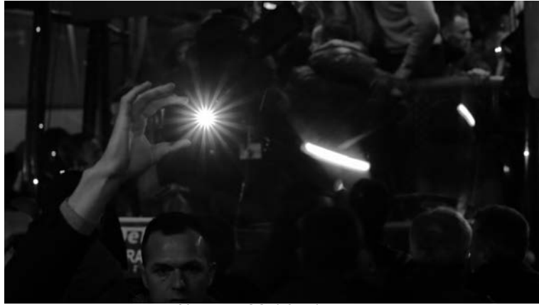
Note on Multitude , 2015

Note on multitude a été filmé à Prisitina au Kosovo où apparaît une foule compacte et inquiète. On y perçoit l'émotion des familles au moment de la séparation où certains d'entre eux vont prendre un bus pour une destination qui leur est inconnue. Les corps des hommes, des femmes et des enfants se frôlent, s'étreignent pour finalement se séparer.