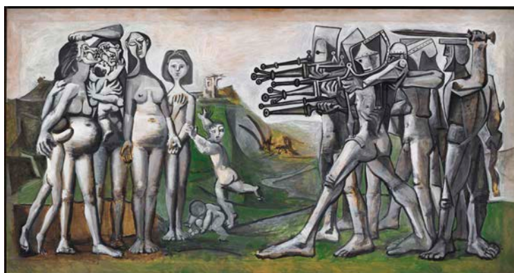
Massacre en Corée, 1951