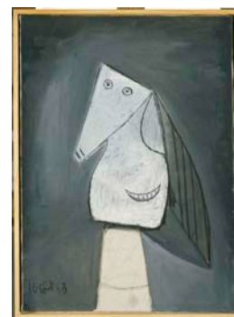
Tête de femme souriante, 1943