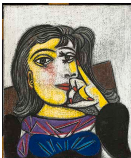
Portrait de Dora Maar, 1937