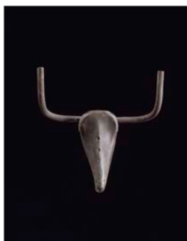
Tête de taureau, 1942