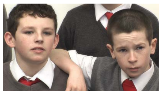
RINEKE DIJKSTRA, I see a Woman Crying, 2009

La fin du parcours permettra de découvrir l'installation vidéo de Rineke Dijkstra « I see a Woman Crying ». Il s'agit d'une installation réalisée à partir de trois projections qui décrivent, sous trois angles différents, les réactions de neuf adolescents devant La Femme qui pleure , portrait de Dora Maar peint par Picasso en 1937. Inspirée par le rituel des visites scolaires au musée, l'artiste enregistre le flux des mots et des émotions qui émane alors de ces jeunes spectateurs. Durant les douze minutes que dure la vidéo, le portrait, laissé hors champ, n'existe qu'à travers leurs voix et leurs visages.