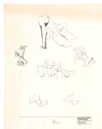
GABRIEL BORBA FILHO, Petit Mobilier brésilien, 1977

Guernica sera évoqué par le film d'Alain Resnais de 1950 mais aussi un ensemble inédit de dessins de l'artiste brésilien Gabriel Borba Filho . Pour la Biennale de Paris de 1977, Borba Filho avait réalisé un ensemble de meubles pour recevoir les figures qui tombent dans le tableau de Guernica , faisant référence à l'histoire espagnole mais aussi au contexte politique du Brésil.