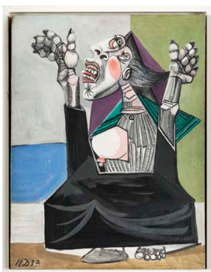
La Suppliante, 1937

L'exposition propose également d'instaurer un dialogue entre les œuvres de Picasso et des artistes contemporains. Il y a, d'une part, au cœur même de l'espace consacré à Picasso la présence d'artistes qui ont porté un regard sur son œuvre. D'autre part, en miroir, l'exposition Lignes de fuite présente des artistes de différents horizons qui sont directement concernés par des conflits au Moyen Orient et en Europe de l'Est.