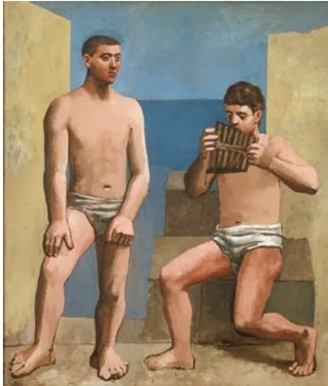
La Flûte de Pan, Pablo Picasso, 1923, Antibes, huile sur toile, 205 x 174 cm, Dation Pablo Picasso, 1979, MP79, Musée national Picasso-Paris © Succession Picasso 2017