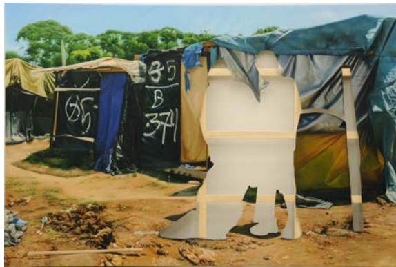
Acampamento Vila Nova Palestina , 2017, détail, huile sur toile, 4 parties, 200 x 300 cm chacune.