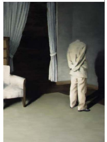
NGUYEN THAI TUAN Interior 2 (détail), Heritage series , 2011, huile sur toile / oil on canvas Collection Dinh Q Lê