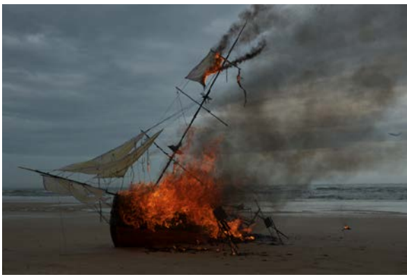
DINH Q LE Erasure (capture d'écran/still), 2011, vidéo