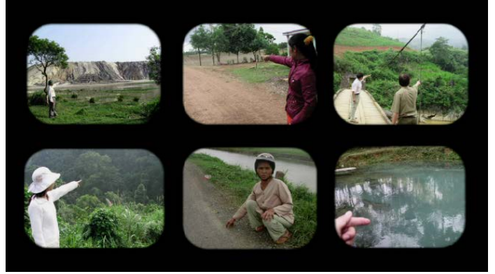
NGUYEN TRINH THI Landscape Series #1 (capture d'écran/still), 2013, vidéo.