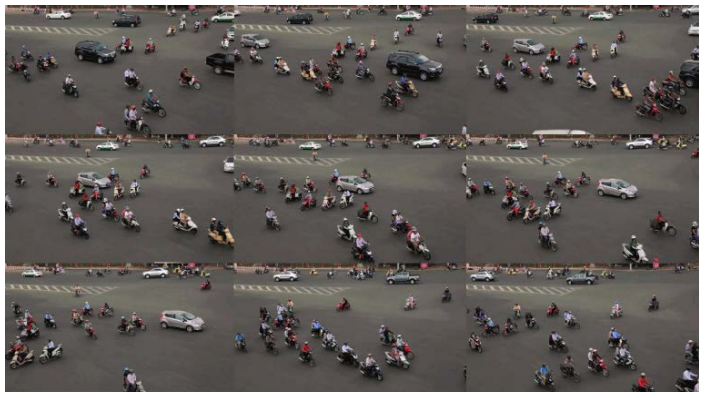
LENA BUI image contextuelle : études sur la circulation à Saigon / contextual image: studies of traffic in Saigon, 2013.