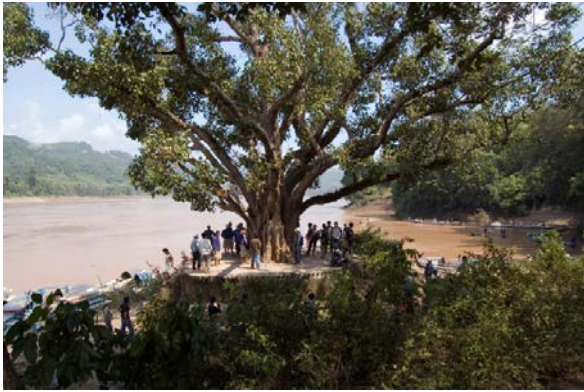
JUN NGUYEN-HATSUSHIBA The Ground, the Root, and the Air: The Passing of the Bodhi Tree (capture d'écran/still), 2004–2007, vidéo.