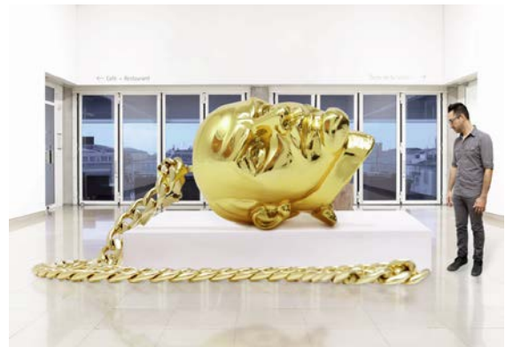
THE PROPELLER GROUP Monumental Bling , 2013, croquis de l'artiste pour l'installation / artist sketch of installation.