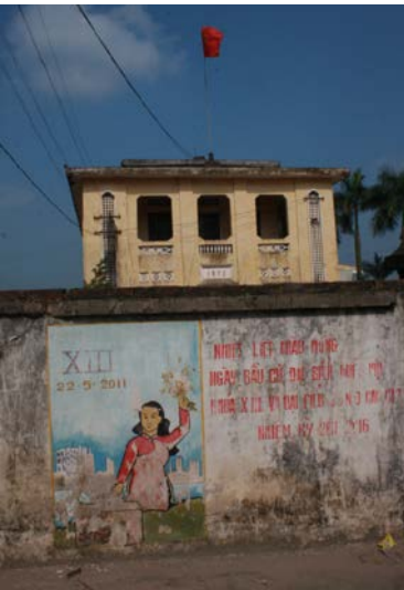
NGUYEN HUY AN image contextuelle : un message local du gouvernement / contextual image: a local government message Courtesy de l'artiste