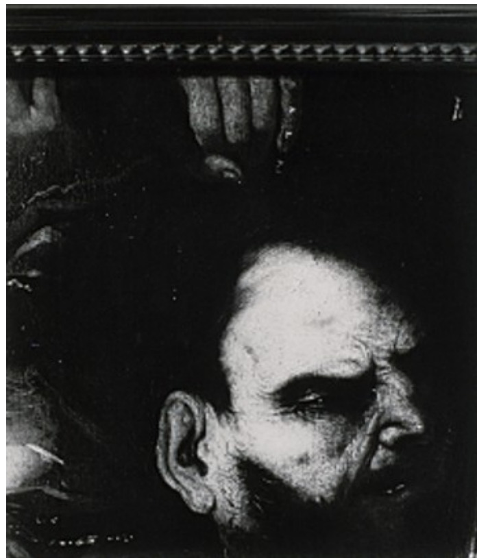
Judith et Holopherne (École Vénitienne du 17ème siècle), 1687