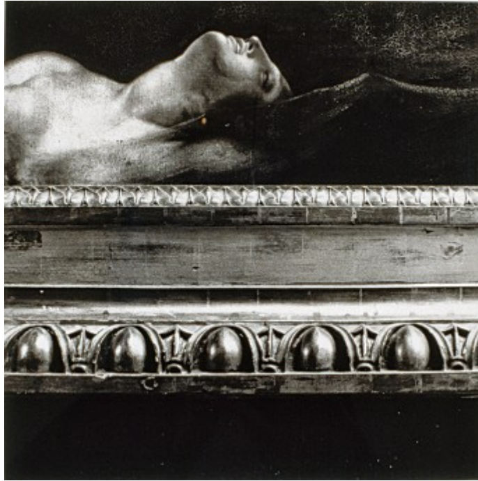
Anne-Louis Girodet Trioson (1767-1824), Le Déluge, 1986