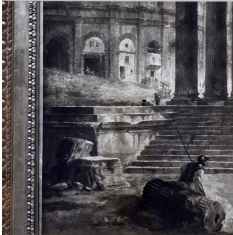
Hubert Robert (1733-1808) La Maison Carrée à Nîmes, 1785