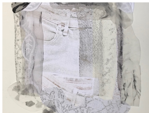
À assembler, à superposer !