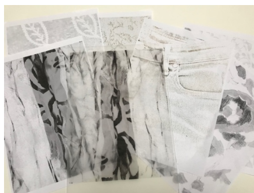
Imprime les images sur calque et papier...