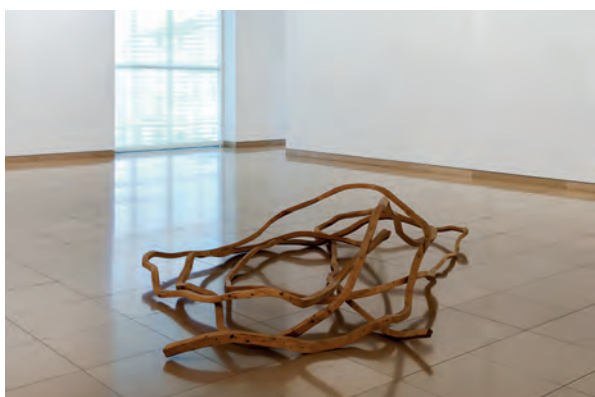
Toni GRAND Sec, équarri, abouté en ligne courbe, 1976