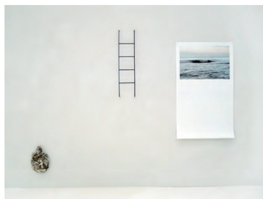
Guillaume LEBLON Giving Substance to Shadow, 2013