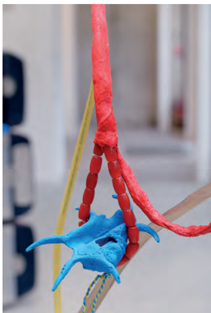
Julien CREUZET Poème en entier, bleu de la mer bleue de la peau, 2018