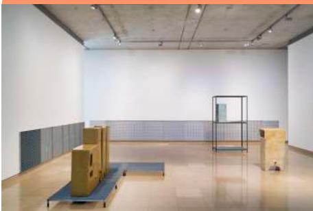
Jumana MANNA, Cache (Insurance Policy) , 2018,

Sculpture en céramique, argile, béton, craie, cendre, structures en métal