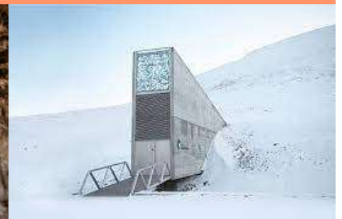
Réserve mondiale de semences du Svalbard, île norvégienne de Spitzberg

En vidéo | https://www.youtube.com/watch?v=nekUzgWAuZM&t=48s&ab_channel=JeudePaume