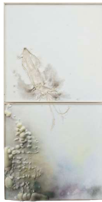
Guillaume LEBLON, La Grande seiche II , 2014, Sculpture, plâtre, polyéthylène, pigment, animal, encre et bois, 204 x 102 x 4 cm.

Par les problématiques abordées et les concepts développés cette thématique s'adresse plutôt aux élèves à partir du cycle 3, collège, lycée.