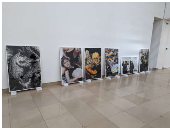
En cours d'installation