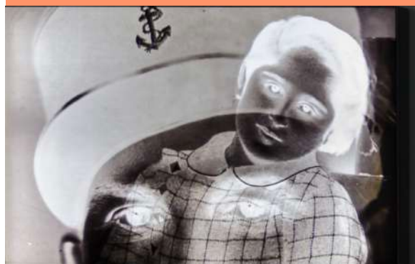
Akram ZAATARI, Faces to faces, #1, 2017, Photographie, impression jet d'encre sur toile UV rétro éclairée, 100 x 150 x 10 cm