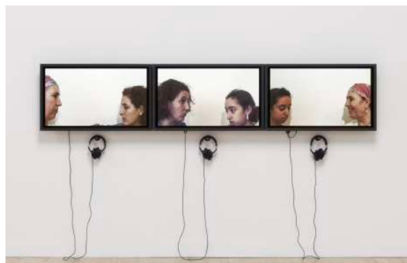
Zineb SEDIRA, Mother Tongue, 2002 , installation, 3 vidéos (couleur, son) sur écrans avec casques audio, 4'38" chaque vidéo, format 4/3, Mother and I (France), Daughter and I (Angleterre), Grandmother and Granddaughter (Algérie).

« Le personnel est politique. » Zineb SEDIRA