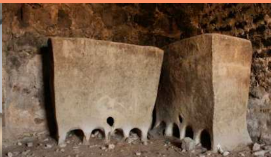
Khabyiyas, jarre palestinienne, servant de contenant.

Sculpture en céramique, argile, béton, craie, cendre, structures en métal