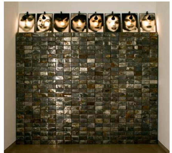
Christian BOLTANSKI, Sans titre (Réserve) , 1991 Installation, photos, boîtes métalliques, lampes électriques, 316 x 397,5 cm.