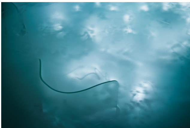
Ponds , 2023.

Verre, découpe au jet d'eau, ponçage, lumières par Martynas Kazimierenas Vue de l'installation de l'exposition Sekretas au Kunstverein, Graz, 2023.