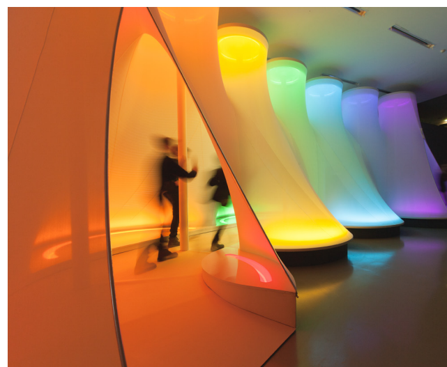
Spectrum. An Afterthought , 1975–2014. Tissu synthétique, lampes au néon, filtres colorés, acier, aluminium, contreplaqué, plastique. 400 x 1056 x 539 cm. The Lithuanian National Museum of Art.