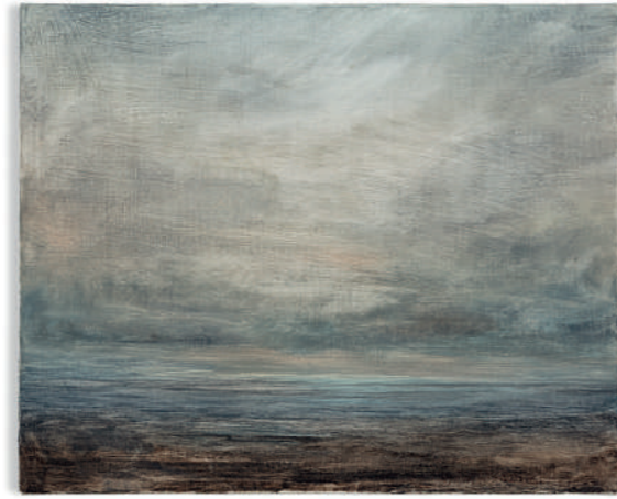
Lucas Arruda, Untitled (from the Deserto-Modelo series) , 2013 Huile sur toile 30 x 37 cm

Face aux peintures d'Arruda, on peut penser aux Impressionnistes, à Turner ou à l'histoire de la peinture de paysages au Brésil ou Giorgio Morandi. Comme ce dernier, il utilise toujours la même structure tendant à l'abstraction et à une dimension métaphysique. Comme chez Morandi, l'absence de figures humaines invite à l'introspection et à la méditation en évitant toute narration. Techniquement, son travail est une question de soustraction et d'ajout de matière. Dans les monochromes, des couches de peinture sont superposées sur une toile préparée, la lumière venant de l'arrière. Dans les paysages marins, la peinture est soustraite à l'aide d'un pinceau fin, laissant derrière elle de très fines couches de couleur et de lumière.