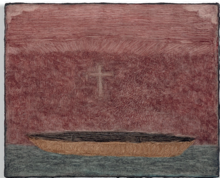
Lucas Arruda Untitled (from the Deserto-Modelo series), 2024 Huile sur toile 24 x 30 cm

Arruda s'intéresse fondamentalement au paysage, à la pensée humaine et à l'expérimentation de notre capacité à vivre à travers la médiation de la lumière et du regard. Ses paysages existent au point de tension entre l'abstraction et la figuration, entre l'apparence et le vide.