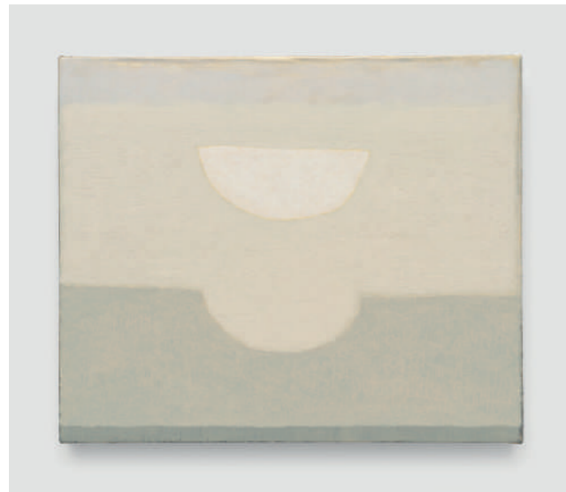
Lucas Arruda Untitled (from the Deserto-Modelo series), 2024 Huile sur toile 30 x 36 cm

Du 30 avril au 5 octobre 2025, et dans le cadre de la Saison 2025 du Brésil en France, Carré d'Art – Musée d'art contemporain de Nîmes consacre deux expositions monographiques aux artistes brésiliens contemporains : Lucas Arruda et Ivens Machado.