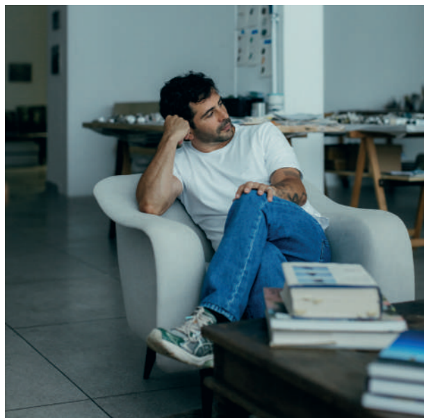
Lucas Arruda, 2025

Ses œuvres font partie des collections de l'Art Institute of Chicago ; Boros Collection, Berlin ; Buffalo AKG Art Museum, Buffalo, New York ; Centre Pompidou, Paris ; Fondation Beyeler, Bâle ; Fondazione Sandretto Re Rebaudengo, Turin ; Hirshhorn Museum and Sculpture Garden, Washington, DC ; Institute of Contemporary Art, Miami ; K11 Art Foundation, Hong Kong ; Kunstmuseum Den Haag, La Haye, Pays-Bas ; Long Museum, Shanghai ; M Woods Museum, Beijing ; Moderna Museet, Stockholm ; Museo Jumex, Mexico ; Museu de arte de São Paulo Assis Chateaubriand (MASP) ; Museum of Fine Arts, Boston ; Museum Ludwig, Cologne ; Pérez Art Museum, Miami ; Pinacoteca do Estado de São Paulo ; Pinault Collection, Paris ; Rockbund Art Museum, Shanghai ; Rubell Museum, Miami ; Solomon R. Guggenheim Museum, New York ; Stedelijk Museum, Amsterdam ; Tate, Royaume-Uni ; TBA21 Thyssen-Bornemisza Art Contemporary, Madrid ; et le X Museum, Beijing. Arruda vit et travaille à São Paulo.