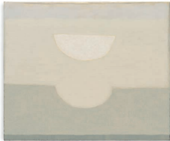
Lucas Arruda Untitled (from the Deserto-Modelo series), 2024 Huile sur toile 30 x 36 cm

Du 30 avril au 5 octobre 2025, et dans le cadre de la Saison 2025 du Brésil en France , Carré d'Art – Musée d'art contemporain de Nîmes consacre deux expositions monographiques aux artistes brésiliens contemporains : Lucas Arruda et Ivens Machado.