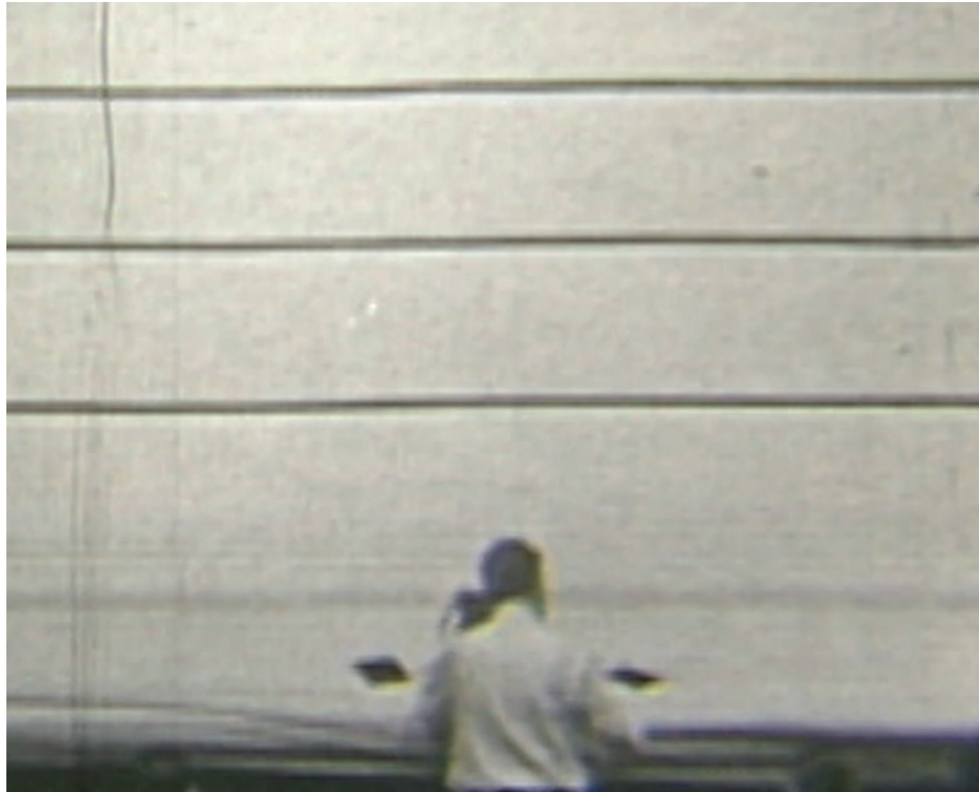
Lucas Arruda Image extraite de Untitled (Neutral Corner) , 2018 Vidéo, 4'27"

L'artiste travaille généralement sur de petits formats horizontaux pour ses marines ; ses peintures de jungles sont réalisées sur des toiles carrées, mettant en valeur la verticalité des arbres. Sa grande virtuosité réside dans sa capacité à contenir dans un espace réduit ce qui est du domaine de l'infini, afin de concentrer les radiations et les fréquences de la lumière.