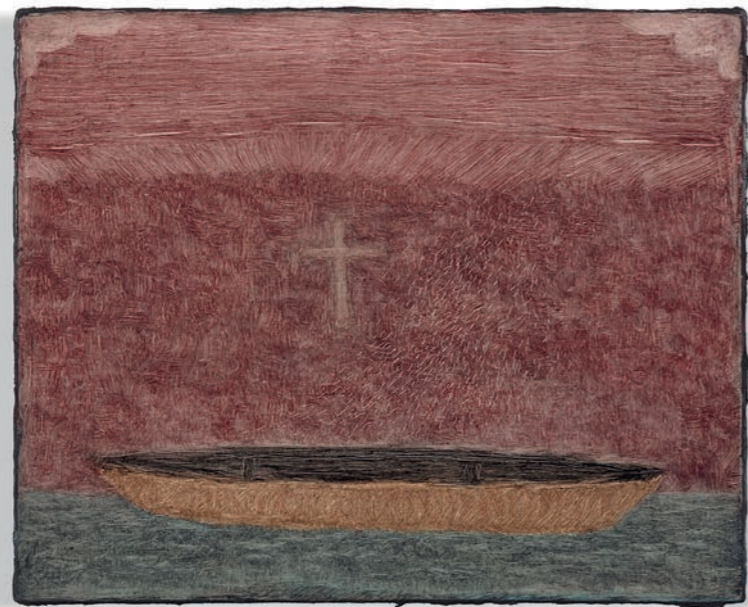
Lucas Arruda Untitled (from the Deserto-Modelo series), 2024 Huile sur toile 24 x 30 cm Photo : Everton Ballardin Courtesy the artist, David Zwirner et Mendes Wood DM

Arruda s'intéresse fondamentalement au paysage, à la pensée humaine et à l'expérimentation de notre capacité à vivre à travers la médiation de la lumière et du regard. Ses paysages existent au point de tension entre l'abstraction et la figuration, entre l'apparence et le vide.