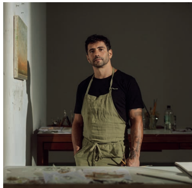
Lucas Arruda, 2025 Photo : Gui Gomes © Lucas Arruda. Courtesy the artist, David Zwirner et Mendes Wood DM

Les œuvres d'Arruda font partie des collections de l'Art Institute of Chicago ; Boros Collection, Berlin ; Buffalo AKG Art Museum, Buffalo, New York ; Centre Pompidou, Paris ; Fondation Beyeler, Bâle ; Fondazione Sandretto Re Rebaudengo, Turin ; Hirshhorn Museum and Sculpture Garden, Washington, DC ; Institute of Contemporary Art, Miami ; K11 Art Foundation, Hong Kong ; Kunstmuseum Den Haag, La Haye, Pays-Bas ; Long Museum, Shanghai ; M Woods Museum, Beijing ; Moderna Museet, Stockholm ; Museo Jumex, Mexico ; Museu de arte de São Paulo Assis Chateaubriand (MASP) ; Museum of Fine Arts, Boston ; Museum Ludwig, Cologne ; Pérez Art Museum, Miami ; Pinacoteca do Estado de São Paulo ; Pinault Collection, Paris ; Rockbund Art Museum, Shanghai ; Rubell Museum, Miami ; Solomon R. Guggenheim Museum, New York ; Stedelijk Museum, Amsterdam ; Tate, Royaume-Uni ; TBA21 Thyssen-Bornemisza Art Contemporary, Madrid ; et le X Museum, Beijing. Arruda vit et travaille à São Paulo.