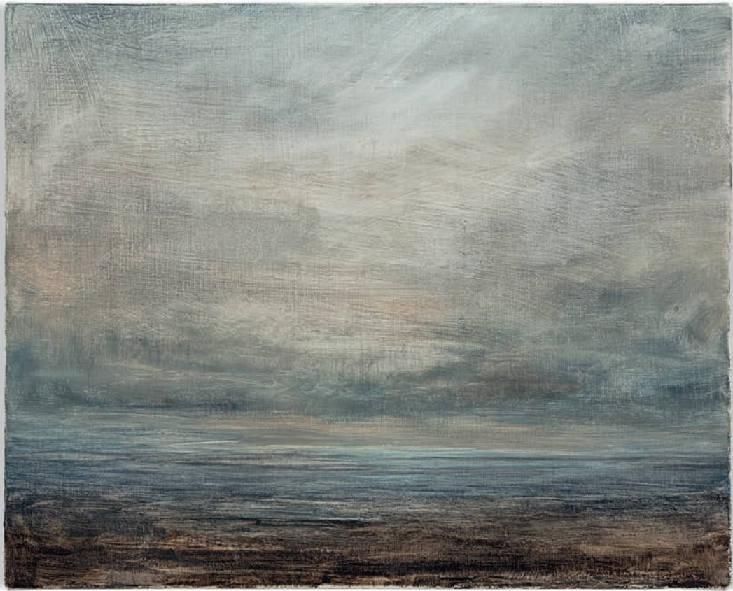
Lucas Arruda, Untitled (from the Deserto-Modelo series) , 2013, huile sur toile, 30 x 37 cm.