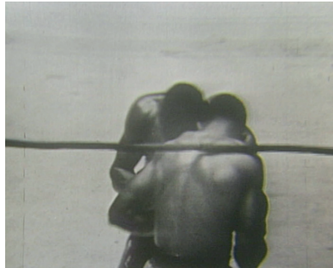
Lucas Arruda Image extraite de Untitled (Neutral Corner) , 2018 Vidéo, 4'27"

L'installation Untitled de 2019 est composée d'un carré de lumière projeté au-dessus d'un carré peint sur le mur. Arruda parle d'« idéogramme de paysage », une représentation minimale de l'horizon, un moment de révélation et une réflexion sur la relation entre l'immatériel et le matériel. « Cet équilibre entre les parties supérieures et inférieures provient du désir de trouver un équilibre entre les rêves et la réalité. » Lucas Arruda, entretien catalogue Ibero Camargo.