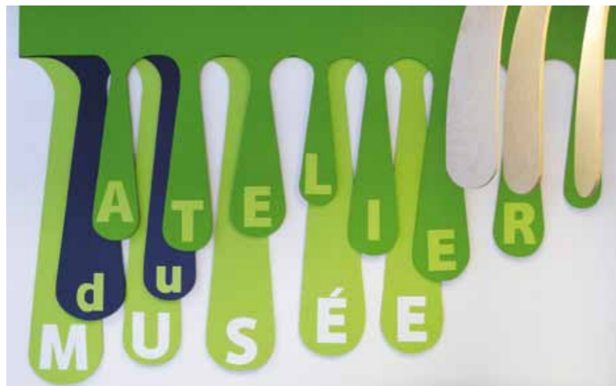
CONCEPTION MATAI CRASSET

ACCUEIL À L'ATELIER DU MUSÉE AU 1 ÈR ÉTAGE DE CARRÉ D'ART.