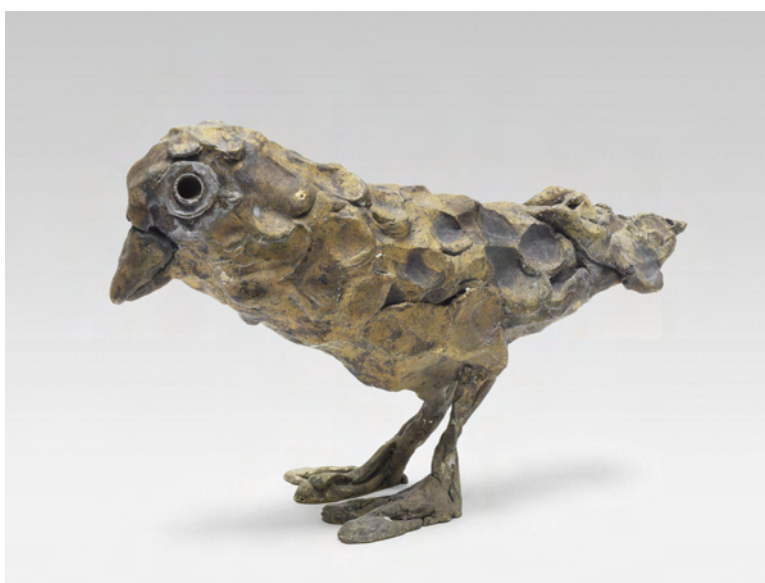
Primitive, 2011-2012 - Détail