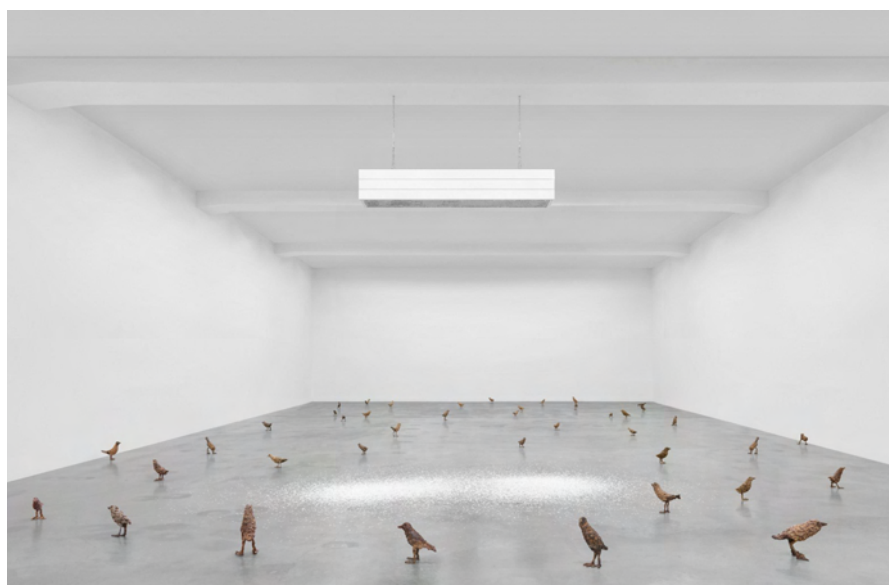
Primitive, 2011—2012 et Thank you Silence, 2005