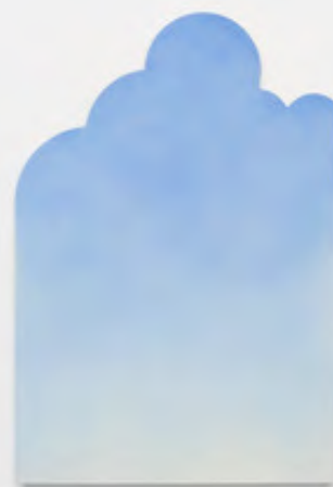
Fünfundzwanzigsterjunizweitausen dundfünfzehn, 2015,

Encre sur papier, plaque de plexiglas avec légende, 272 x 427 x 3cm. ©Ugo Rondinone