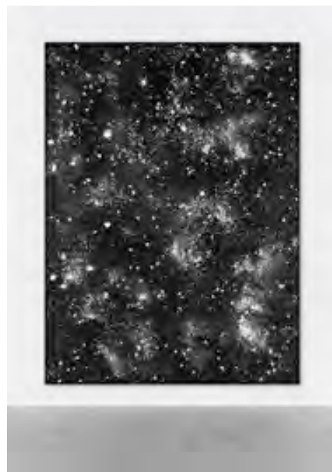
N°559 DREISSIGSTERNOVEMBERZWEITAUSEN DUNDACHT, 2008 , peinture acrylique sur toile, plaque de plexiglas avec légende, 430 x 320 x 4,5cm. ©Ugo Rondinone