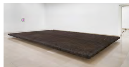
Elevated rectangle landscape , 2016

L' exposition est un cycle en elle-même, qui se répète et recommence sans prendre fin, comme le cycle des saisons représenté métaphoriquement ou directement dans les œuvres exposées, à l'image de cette installation qui déverse de faux flocons de neige, au milieu d'un parterre d'oiseaux figés ( Thank you silence , 2005). Tout est cycle, tout renaît, pour recommencer . Dans le catalogue d'exposition, Corinne Rondeau résume ainsi Becoming soil : « Puissances artificielles de la nature : Humus, encens, couleurs, flocons, oiseaux, chevaux, souffle, paysages, nuits étoilées, lune, poissons, nuages, main. ». Les quatre éléments l'eau, la terre, l'air, le feu, y sont à la fois présentés et représentés.