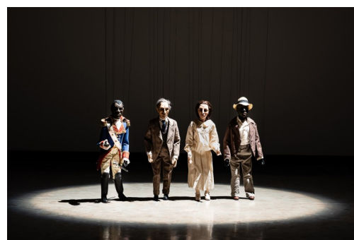
The Dramatist , 2013

Transport: Les élèves possédant la carte de bus du réseau Edgard peuvent venir gratuitement à Nîmes.