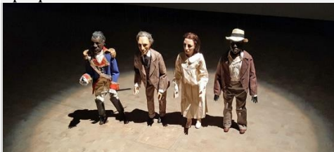
The Dramatist (Black Hamlet, Crazy Henry, Giulia, Toussaint), 2013.

Anachronie : En rupture avec son époque.