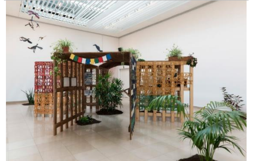
Anna BOGHIGUIAN Jardin de l'inconscient , 2016. Installation. Bois, broue de noix, peinture, cire.