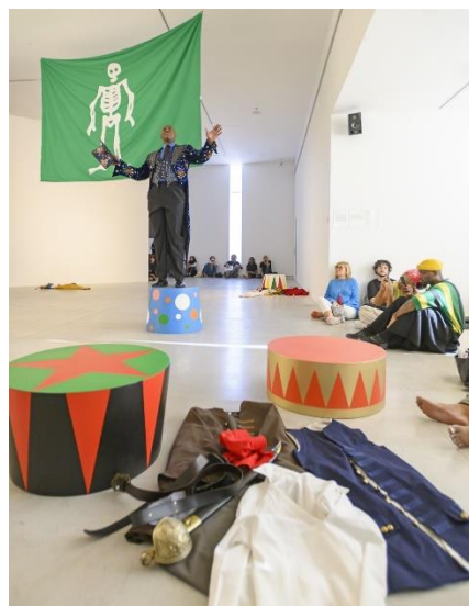
No prey, no pay (2018-19)

No prey, no pay (2018-19) envahit l'espace de la salle 5 pour dévoiler sept socles de cirque peints, accompagnés de leurs habits délaissés au sol . L'ensemble est surmonté d'un immense drapeau représentant un squelette blanc sur un fond vert uni. Brandi comme une toile de pirate, l'ensemble propose au spectateur de construire un récit pour s'approprier ses restes de manière fictive.