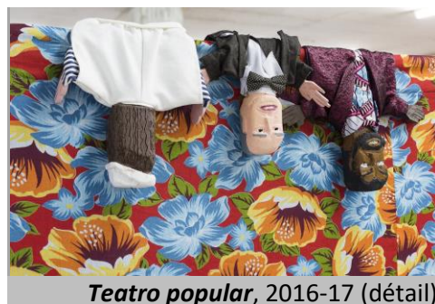
Teatro popular , 2016-17 (détail)

« J'aime le théâtre en tant que musée. {...} Exposer quelque chose n'est jamais normal ; exposer l'histoire est encore plus problématique. »* Peter Friedl, extrait de l'interview avec Claire Tancons.