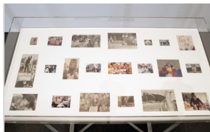
Theory of Justice , 1992-2010

De même Theory of Justice , 1992-2010 (salle 6) montre huit îlots de vitrine, exposant des images imprimées issues de coupures de journaux . Cela ressemble aussi à un travail de recherches dans le processus créatif de l'homme de théâtre. Ces images sont autant de récits intimes, historiques, publics ou privés à construire.