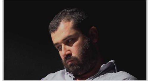
Photogramme de la vidéo, Study for Social Dreaming , 2014-17.

ses comédiens, à partir d'évènements qu'ils ont vécus pour rechercher l'émotion ressentie à ce moment-là afin de la rejouer sur scène. A travers cette vidéo qui s'apparente davantage à un « faux documentaire » d'une chaîne culturelle, l'artiste donne une autre version.