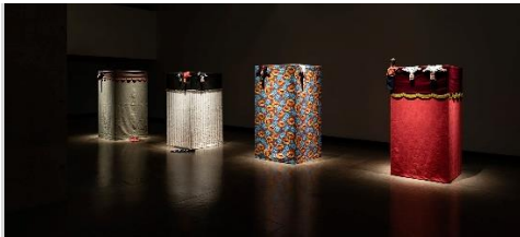
Vue de l'installation Teatro popular

peint pour la tête et les mains, le reste est en tissu. Quelques personnages sont reconnaissables issus de l'histoire coloniale portugaise et brésilienne, ainsi que le célèbre collectionneur d'art Gulbenkian qui détient une fondation à son nom à Lisbonne. Les marionnettes figées, immobiles, intemporelles tiennent à l'écart le spectateur de cette histoire, de ces récits historiques pour mieux les rejouer ou les jouer dans son esprit actuel, pour répondre à cette « achronie et anachronie »* que recherche l'artiste.