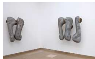
Deep furrow, 2021 , aluminium moulé, cire, acier chromé.

Présentez l'ensemble des réalisations de la classe dans un espace défini. Un cartel pourra accompagner cette présentation.