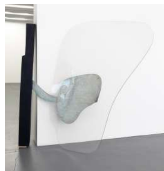
Big valve, 2016 , métal zingué, polyuréthane peint, polycarbonate, 184.9 x 184.9 x 32.9 cm.

Appropriiez-vous un angle pour élaborer un volume qui occupera son territoire. Technique de fabrication en volume : Assemblage, modelage, volume en papier... Photographiez votre réalisation.