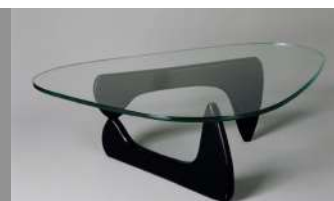
Isamu NOGUCHI, Table basse, 1944-47 , piétement en bouleau laqué, plateau de verre, 40 x 128 x 92 cm