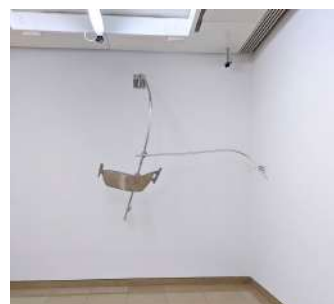
Scruff of the Neck, 2016 , aluminium poli, 213 x 182 x 80cm.

« Cette première mutation se dessine très tôt dans l'art du xx siècle probablement dès les Papiers collés des années 1910. Elle touche les objets de l'art et la nature de la création : le créateur d'œuvres devient progressivement un producteur d'expériences, un illusionniste, un magicien ou un ingénieur des effets, et les objets perdent leurs caractéristiques artistiques établies. Les tableaux accueillent des fragments de papier peint ou de linoléum, des collages, des bouts d'objets et d'éléments de récupération - jusqu'au moment où il n'y aura plus de tableau du tout au sens de la convention d'une surface colorée. Des installations d'objets ou des performances deviennent œuvres. Les intentions, les attitudes et les concepts deviennent des substituts d'œuvres. Ce n'est pas pour autant la fin de l'art : c'est la fin de son régime d'objet. »