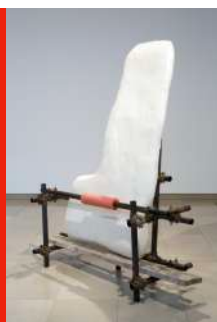
Jumana MANNA, Heel, 2016 , pigment, résine, fibre de verre, laque, échafaudage, bois et mousse, 212 x 189 x 70cm.