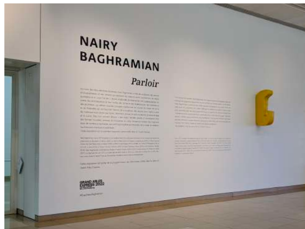
Vue de l'entrée de l'exposition