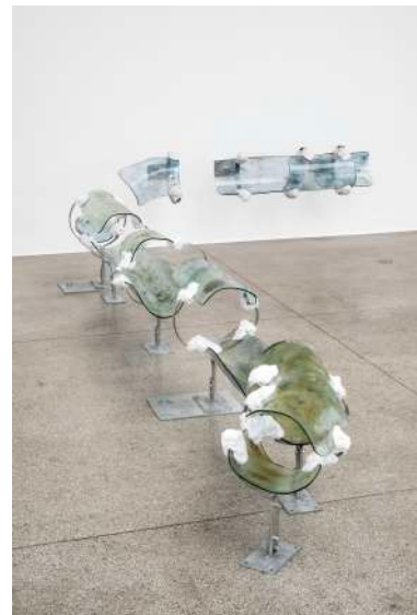
Dwindler_Dizzle (blue/green), 2021 , verre, métal zingué, résine époxy colorée, 200 x 46 x 42 cm.