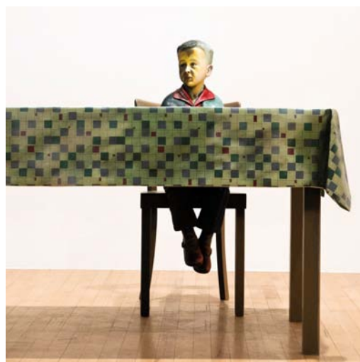
FORMES BIOGRAPHIQUES 29 Mai—20 Septembre 2015

Visite libre gratuite pour les scolaires. Accueil sur rendez-vous du mardi au vendredi de 10h à 18h.