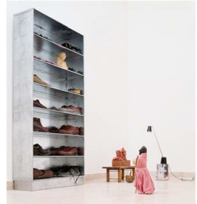
Thomas SCHÜTTE, Mohr's life : The Sculptor, (La vie de Mohr : le sculpteur), 1988-1999,

« Je truque des images de moi pour que la fiction complète le réel, pour montrer ma vie transposée dans le champ de l'impossible et mon histoire réinventée : je suis un autre. »