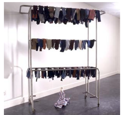
Thomas SCHÜTTE, Mohr's life, (La vie de Mohr : le sculpteur), 1988-1999,

Chaussures, étagère en métal, figure (argile polymère, tissu, corde, brique, argile crue peinte, petit panier en osier contenant des clous, tabouret en bois, boîte de conserve, lampe de lecture, env. 160 x 210 x 180 cm