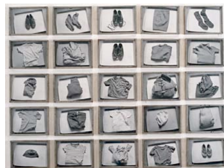
Christian BOLSTANSKI, Les habits de François C, 1971.

Ensemble de 25 photographies noir et blanc, 24 x 30 cm chacune.