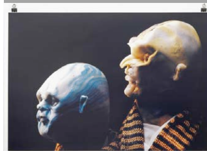
Thomas SCHÜTTE, United Enemies (Extrait), 1994, Impression offset couleur, 63 x94 cm.