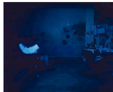
Kerry James MARSHALL, Black Artist (Studio View), (Artiste noir [vue d'atelier]), 2002, Impression jet d'encre sur papier.

« Je peins un grand autoportrait fictif dans lequel j'interprète l'actualité en prenant modèle sur des photos de journaux relatant des évènements qui me concernent ou qui me touchent. »