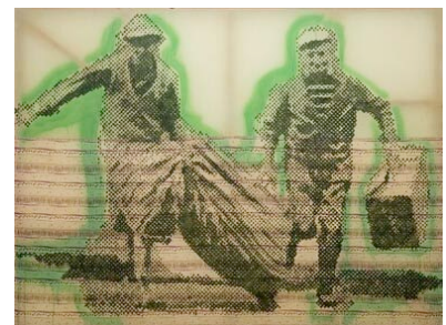
Sigmar POLKE, Flüchtende, (Fugitifs), 1992,

2 figures, 4 tableaux à l'huile sur chevalets, 2 boîtes de conserves peintes, chaussettes, étendoir en acier, env. 180 x 350 x 300 cm.