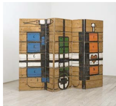
ÉTIENNE-MARTIN, Paravent, 1965.

« J'invente et je peins un univers immense, personnel et intime pour montrer une émotion forte ressentie devant une photo importante dans ma propre vie par le lieu, l'évènement, les personnes ou le sentiment qu'elle représente. »