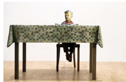
Martin HONERT, Foto (Klein-Martin am Tisch), (Photo [Petit Martin à la table] ), 1993. Huile et acrylique sur bois, résine époxy, 100 x 100 x 123cm.

Thomas SCHÜTTE , autre artiste allemand, joue dans ses installations du rapport d'échelle. Les trois œuvres présentées à Carré d'art, de la série Mohr's Life , utilisent des petites figurines en résine qui donne l'échelle, comme si l'installation était une maquette d'architecture. Une impression de gigantisme face au personnage minuscule, se dégage de l'étagère où est rangée une série de chaussures utilisées de l'enfance à la vieillesse, celles de l'artiste qu'il classe et ordonne. En allemand, Mohr est un nom péjoratif , l'équivalent de « nègre », utilisé pour désigner les peuples barbares d'Afrique du Nord. Cependant, Schütte se sert de la figure du « nègre », entendu dans l'univers littéraire. C'est la figure de la petite main discrète, qui travaille dans l'ombre qui l'intéresse. L'artiste livre une représentation de l'artiste peintre, sculpteur, ou encore collectionneur, en nègre . Ces installations induisent un caractère d'étrangeté par une mise en scène faite de contrastes : rapport d'échelle, matériaux employés, couleurs... Les visages des personnages apparaissent monstrueux, où l'empreinte digitale de l'artiste s'inscrit dans la matière modelée, façonnée par la main.