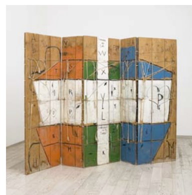
ÉTIENNE-MARTIN, Paravent , 1965.

« La maison nous fournira à la fois des images dispersées et un corps d'images. », Gaston BACHELARD, La poétique de l'espace (1957).