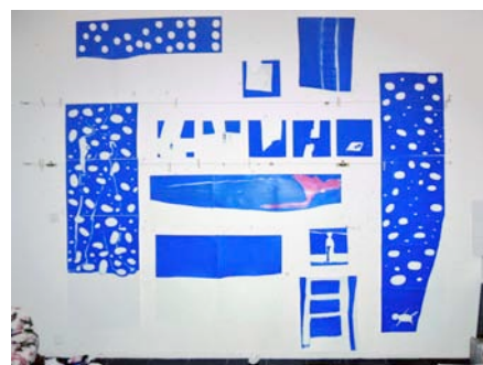
Anne-Marie SCHNEIDER, La Mer bleue, 2002.

Bois, corde, câble, peinture, feutre, craie, graphite. Ensemble de 5 panneaux, 179 x 259 x 5 cm